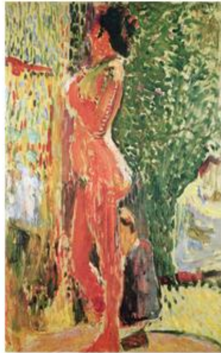
Nu en studio, Henri Matisse, peinture à l'huile, 1899

Nous continuons la visite. A droite dans l'angle se trouve la peinture représentant trois personnes nues. Henri Matisse a peint de nombreuses toiles avec cette représentation de trois individus nus comme Le luxe (1907), Musique (1907), ou encore Jeux de boules (1908).