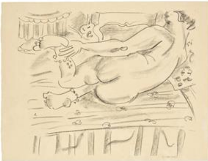
Nu allongé , Henri Matisse, dessin en crayon en papier, 24*32.2cm, 1930