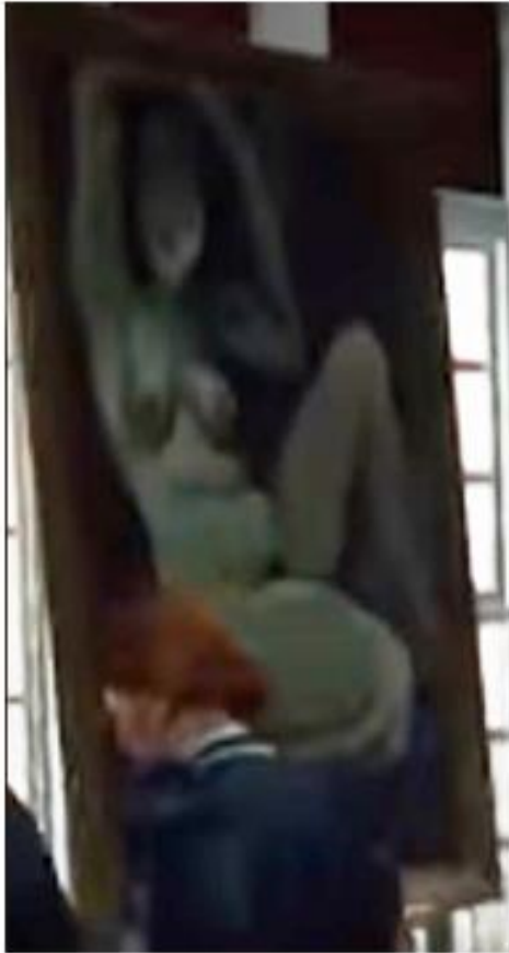
Extrait du jeu RedDead Redemption 2 Photographie