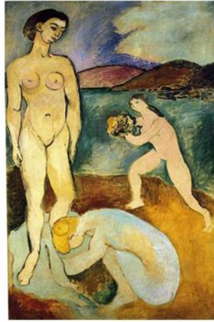
Le Luxe, Henri Matisse, peinture à l'huile, 1907

Le tableau suivant semble représenter un homme nu avec un chapeau de paille au bord d'un lac ou d'une plage. Le décor évoque les tableaux Bosquets au bord de la Garonne (1900), Le golfe de Saint Tropez (1904), ou encore La rive du fleuve (1907). Cependant, le personnage renvoi plus au tableau Nu bleu couché au chapeau de paille (1908) de Ernst Ludwig Kirchner. Ce dernier était un peintre expressionniste allemand, cet artiste créé Die Brücke "Le Pont", où de même l'artiste exprime à travers la peinture ce besoin de liberté et de spontanéité. 3 Il se peut que le modèle sur la peinture soit Henri Matisse.