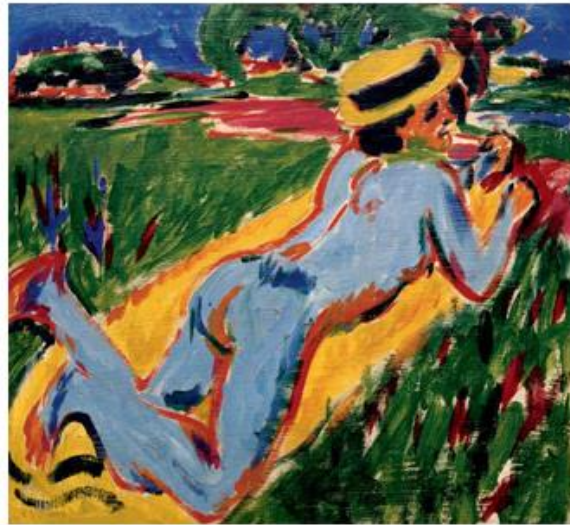
Nu bleu couché au chapeau de paille , peinture à l'huile, Ernst Ludwig Kirchner, 1908

Enfin, le dernier tableau, à droite de la pièce, est un autre nu, où le modèle est de dos, tout en regardant légèrement le public (et le peintre). Henri Matisse, et son goût pour les tenus d'Adam et Eve, a peint de nombreux nus (surtout des femmes) dans presque toutes les positions. Nous pouvons évoquer Nu allongé (1930), ou encore Nu couché de dos (1944).