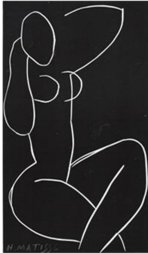
Nu assis avec les jambes croisées, Henri Matisse, 1920

En continuant vers la droite, à l'angle de la pièce, se trouve l'artiste devant un grand tableau, laissant fortement penser à Nu en studio (1899). L'artiste y est devant. Cette présence peut énoncer quelque chose de très pertinent : la datation en commun avec les deux œuvres, c'est à dire 1899.