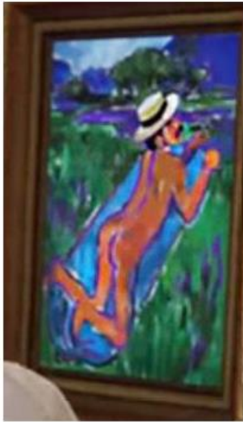
Extrait du jeu RedDead Redemption 2 Photographie