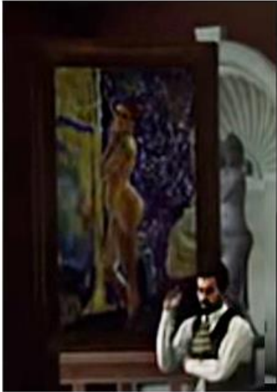
Extrait du jeu RedDead Redemption 2 Photographie