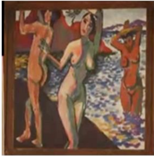
Extrait du jeu RedDead Redemption 2 Photographie